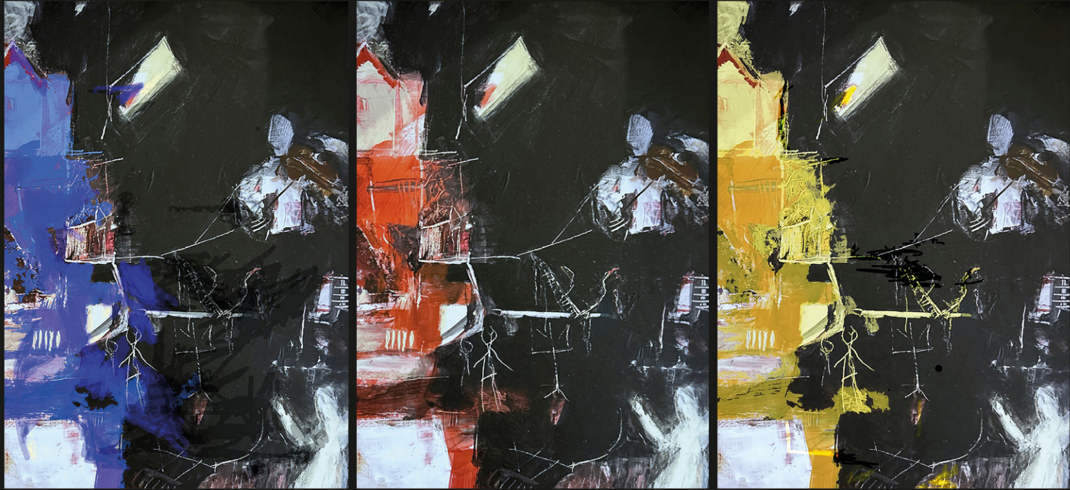
© «Der Geiger», Sylvie Schröder, 2014